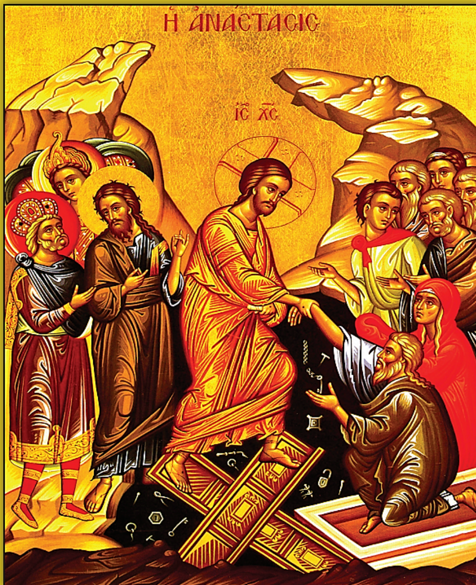
Icon of the Resurrection