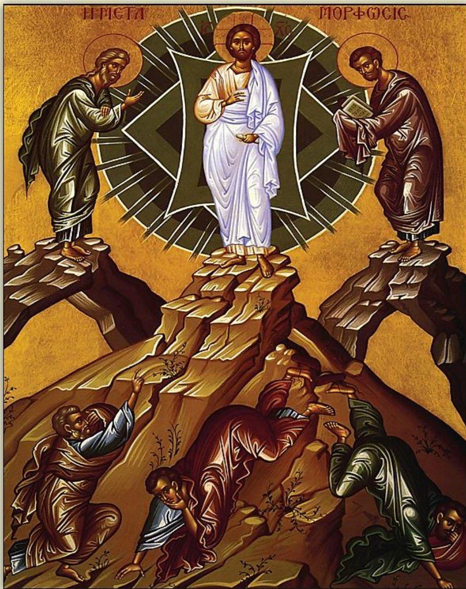
Icon of the Transfiguration of Our Lord