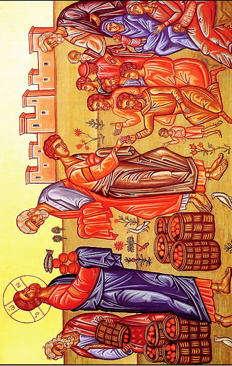
Icon of Jesus Feeding the Five Thousand

Ὁ ΧΡΙΣΤΟΣ Εὐλόγησεν τοὺς πέντε ἄρτους καὶ τοὺς δύο ἰχθύας