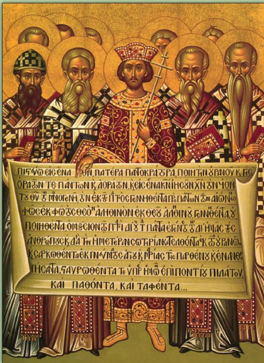
Icon of the Fathers of the First Ecumenical Council of Nicaea