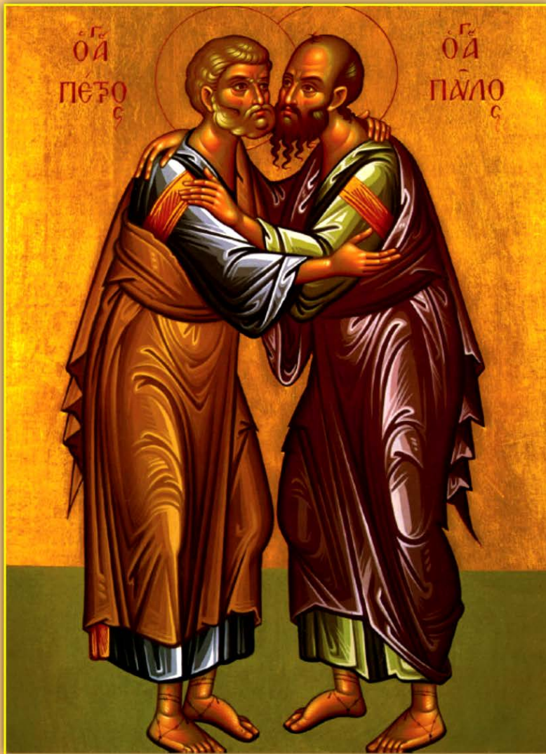
Icon of Saints Peter and Paul -- June 29th