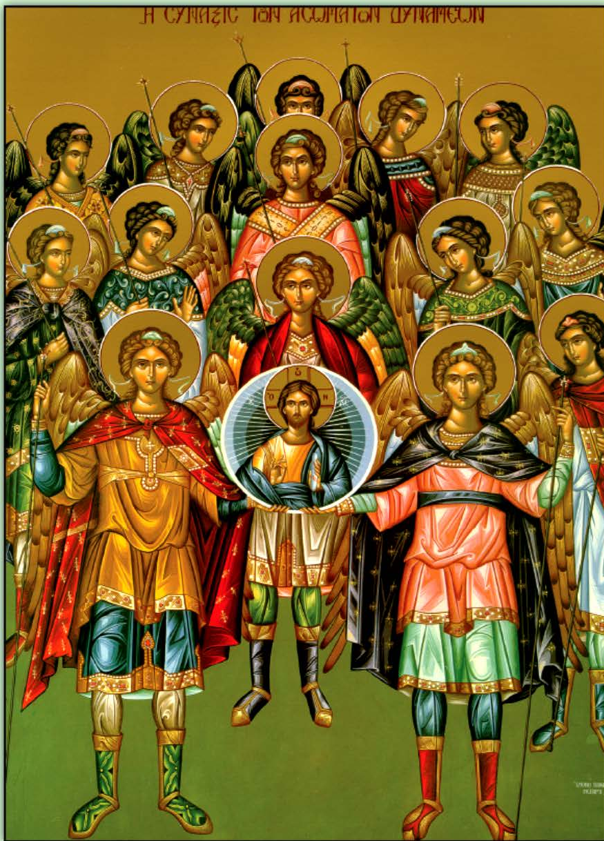
Icon of Saint Michael and all the Angels -- November 8th