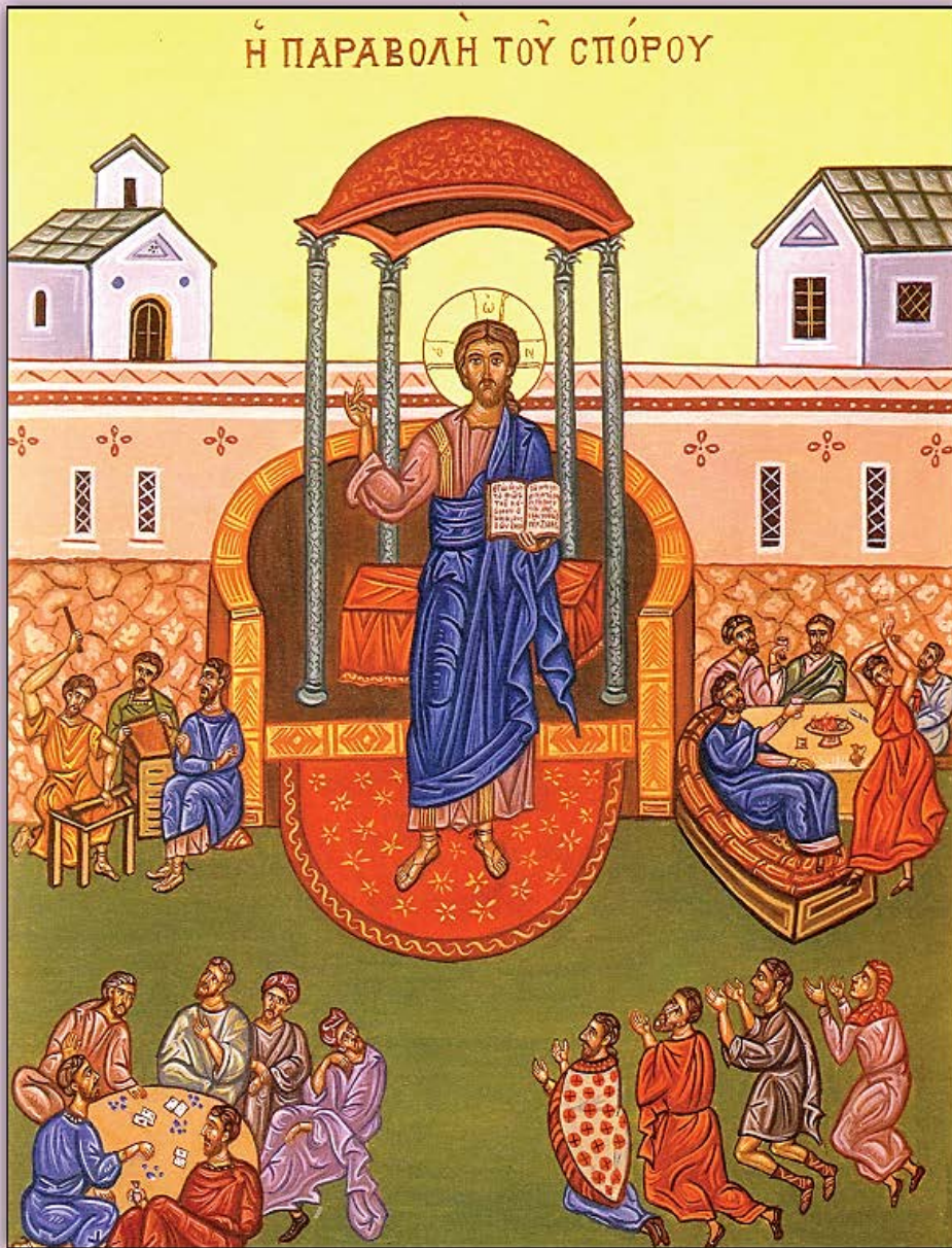
Icon of Parable of the Sower and Seed