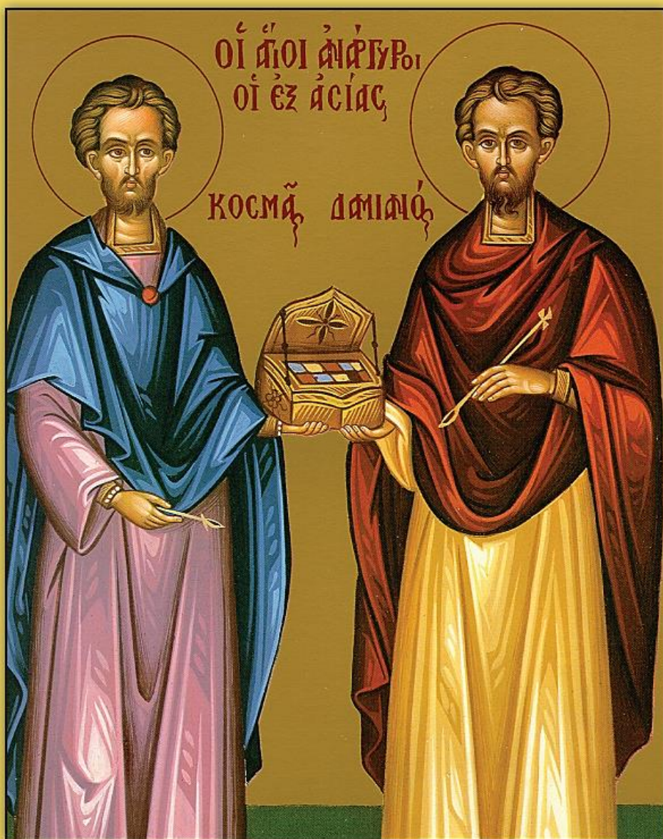
Icon of Saints Cosmas and Damian -- November 1st