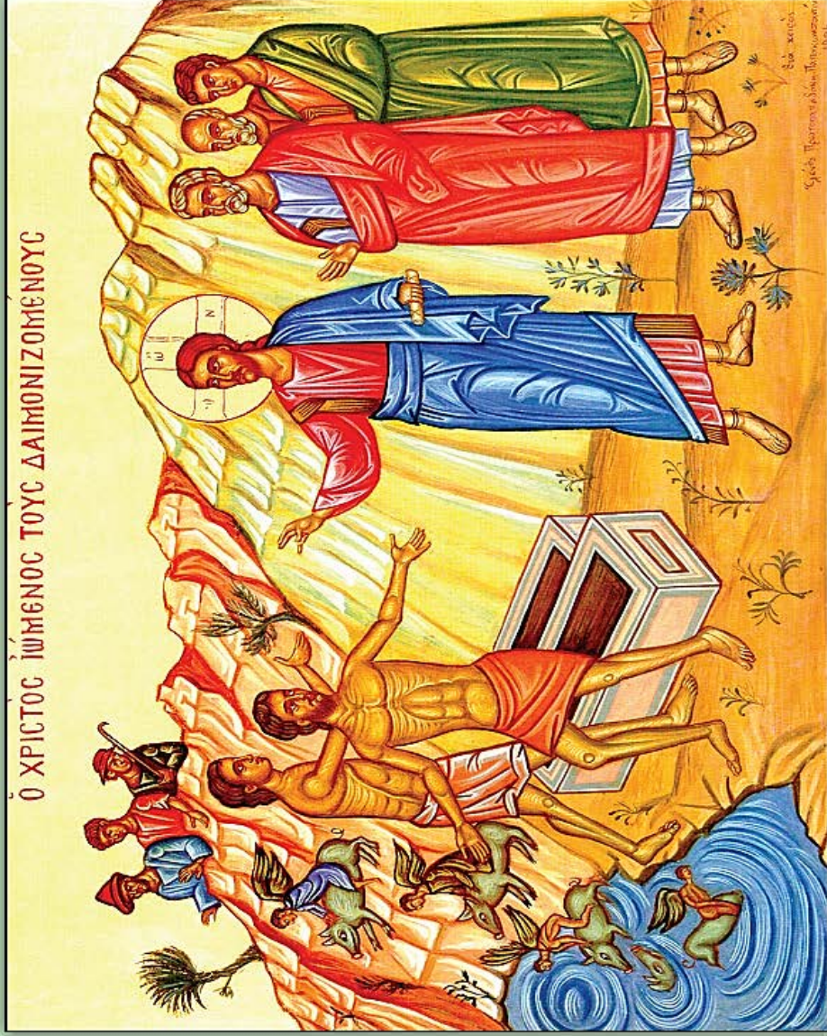
Icon of Christ Healing the Gadarenes