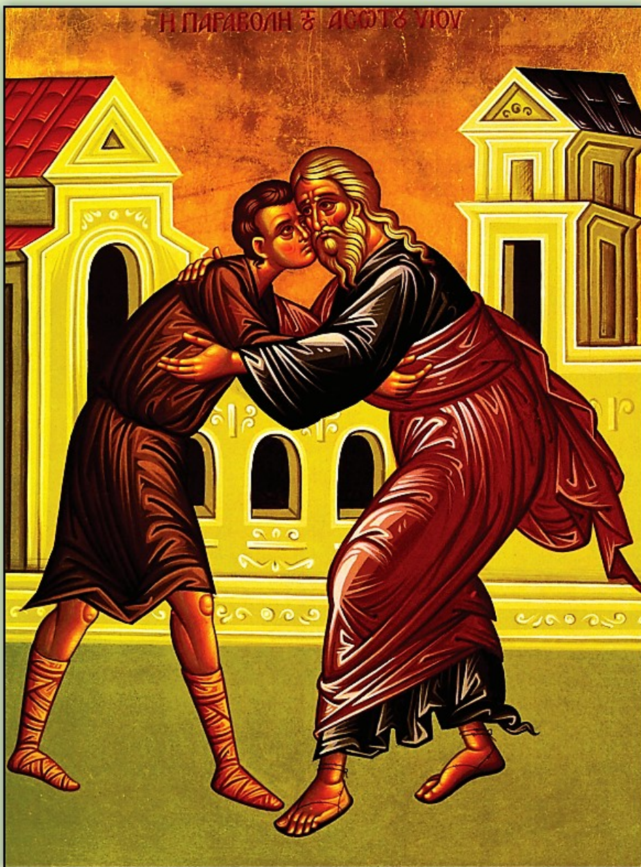
Icon of the Prodigal Son