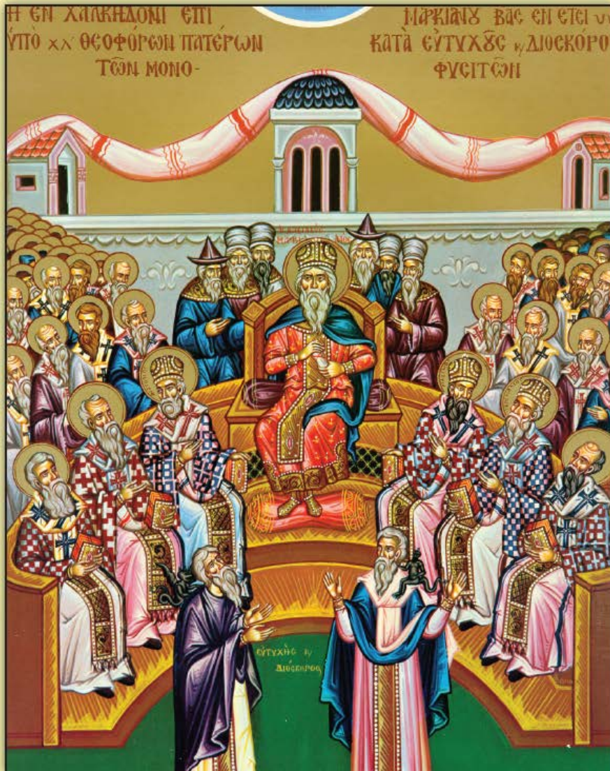
Icon of the Holy Fathers