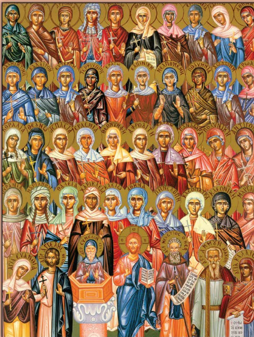
Icon of the 40 Women of Macedonia and Ammon -- September 1st