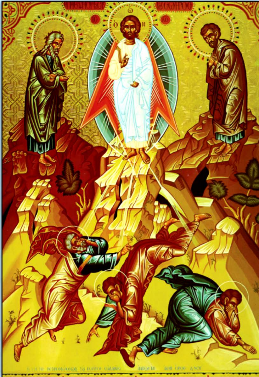
Icon of the Holy Transfiguration -- August 6th