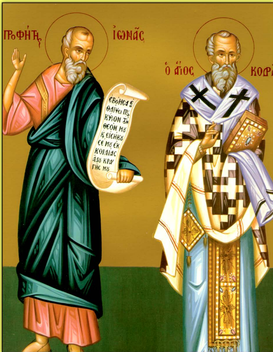
Icon of the Holy Apostle Codratus and Jonah the Prophet -- September 21st