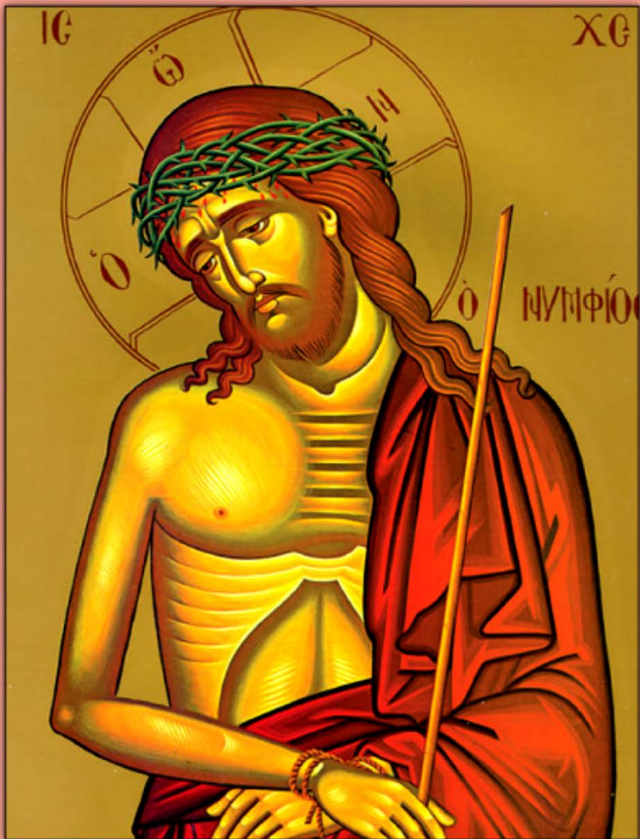
Icon of Christ the Bridegroom